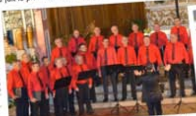
Les Joyeux compagnons ont présenté au public un répertoire très varié.

Le concert de Noël donné par le chœur d'hommes Les joyeux compagnons de Puttelange-aux-Lacs, en l'église Saint-Michel a fait le plein ce dimanche. Et ce dernier a bien tenu toutes ses promesses.