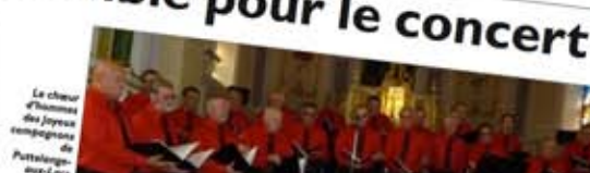
Le chœur d'hommes Les Joyeux compagnons de Puttelange-aux-Lacs a connu un très grand succès.

L'interassociation de Hilspich, en partenariat avec la commune, a organisé un concert de Noël très apprécié. Les Joyeux compagnons ont donné un concert de Noël très apprécié.