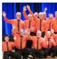
Joyeux Compagnons leur a permis de remporter la troisième place du concours de Noël à l'église de Virming.