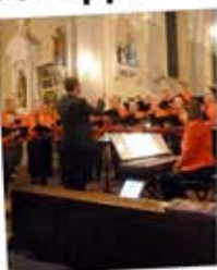
L'ensemble vocal de Puttelange-aux-Lacs.

Le samedi 10 décembre, l'église Saint-Michel de Virming a été le théâtre d'un concert de Noël très apprécié. Les Joyeux compagnons ont donné un concert de Noël très apprécié. Les Joyeux compagnons ont donné un concert de Noël très apprécié.