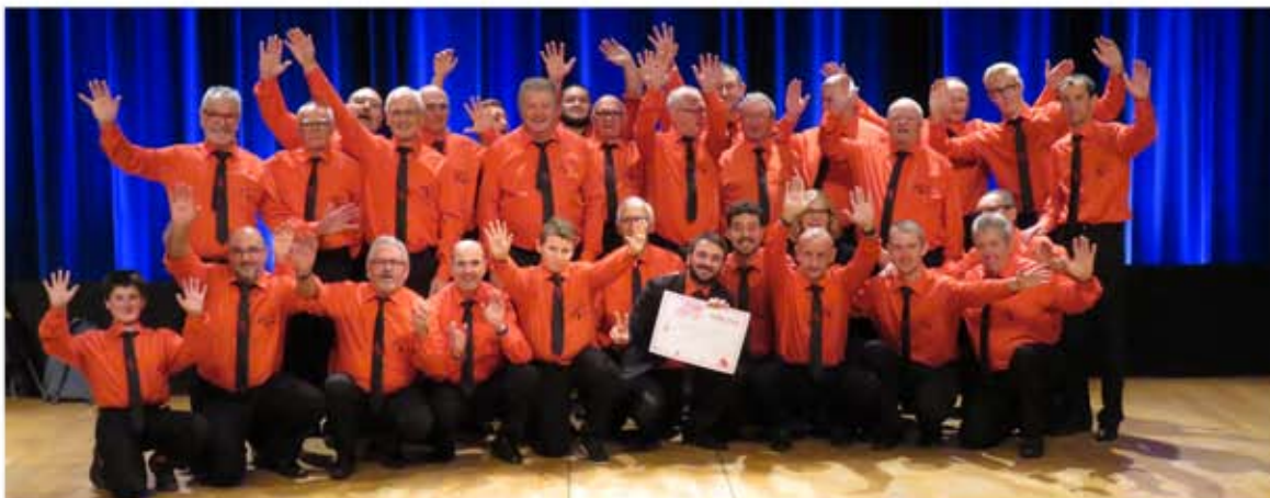
Remise du diplôme pour la 3 ème place au concours des chorales du Grand-Est en octobre 2016