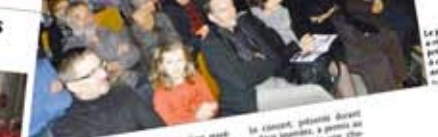
Une belle soirée des Joyeux compagnons qui a été un succès à l'église de Farschviller.

Les Joyeux compagnons ont donné un concert de Noël très apprécié. Les Joyeux compagnons ont donné un concert de Noël très apprécié.