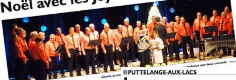
Chœur et instruments.

Il fallait déjà avoir son billet et être présent 100 pour avoir une bonne place à l'espace vocal et instrumental, où le public a vécu des instants forts dans une ambiance de Noël. Le chœur d'hommes qui a chanté les Joyeux compagnons.